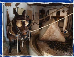
MUSEO ETNOGRÁFICO DE RIOGORDO

Desde el Área de Cultura os deseo muchas felicidades y un buen año 2015.